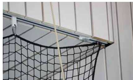
Anschlag mit Klemmplatte