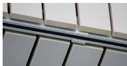
Aufhängemuffe für Laufschiene