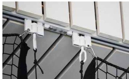
Hänger mit Schnäpper