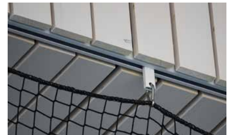
Hänger mit Kugellager